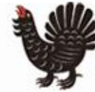
REGIONAL COUNCIL OF CENTRAL FINLAND